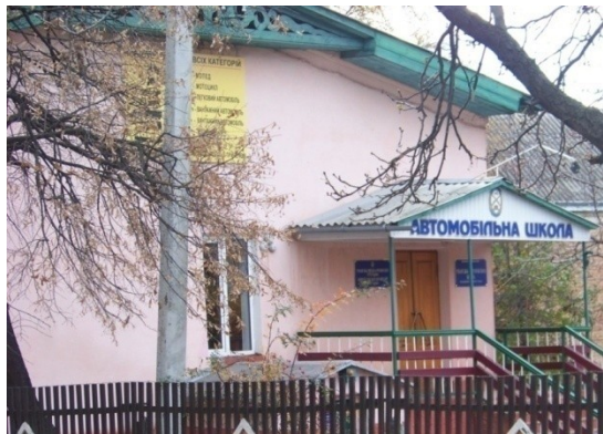
З 2009 р. діяльність відбувається в міській автошколі ТСОУ по вул. Шевченка 1