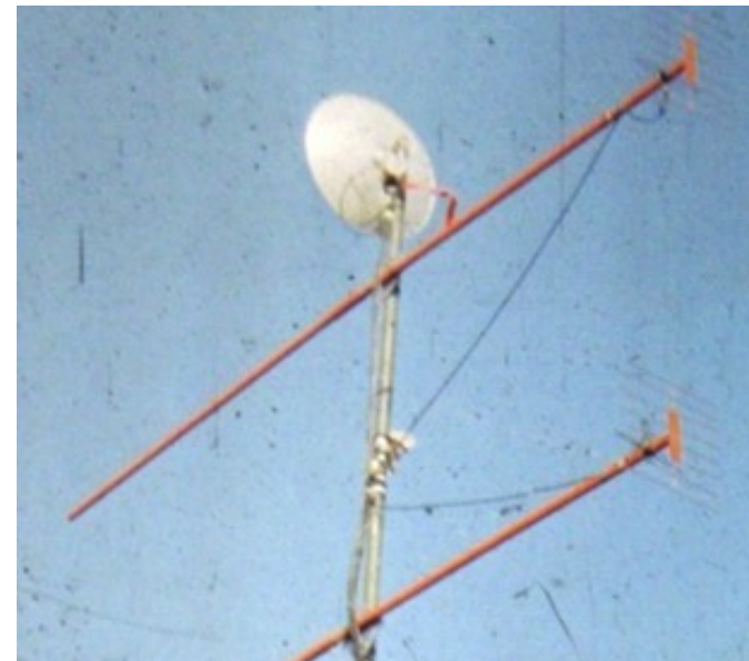
Антенний комплекс Яна Осадченка UB5CAO для ультракоротких хвиль (1980р.)