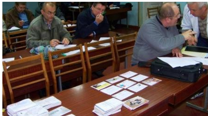
Діє QSL-бюро (2013 р.)