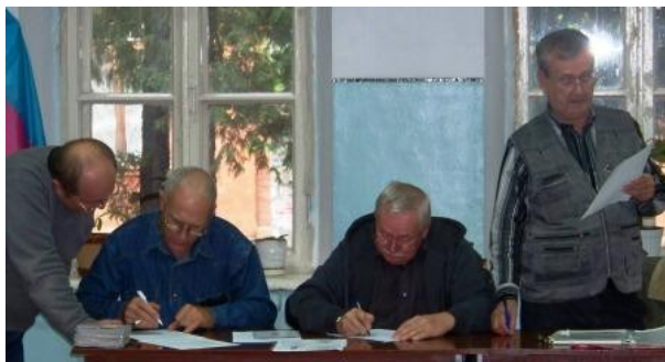
Діє кваліфікомісія (2013 р.)