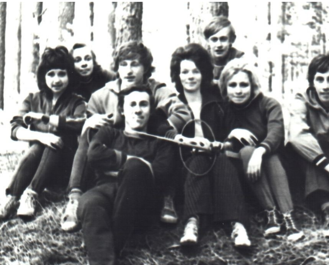
Група уманчан на обласних змаганнях зі спортивної радіопеленгації