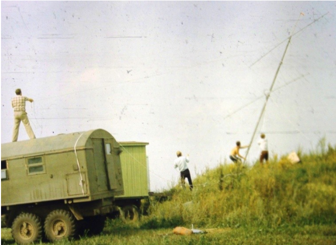
Чемпіонат України “Полевий день , команда RB5CO (1990 р.)