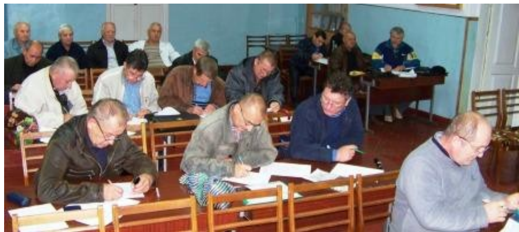
Переоформлення ліцензій (2013 р.)